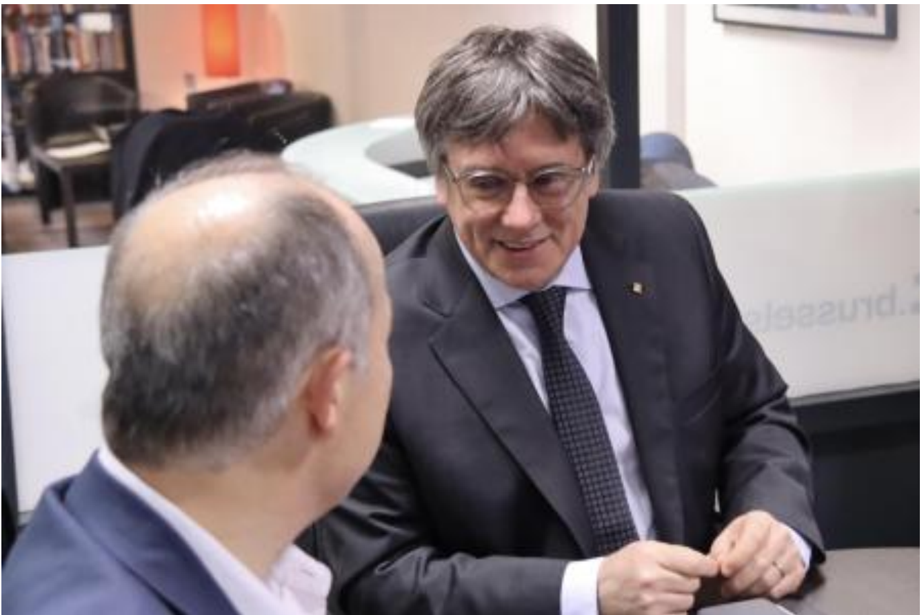
El president de Junts, Carles Puigdemont, en una imatge d'arxiu